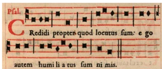
Antiphonier bénédictin, pour les religieuses du royal & célèbre monastère de Mont-Martre, Paris, Louis Sevestre, 1646, p. 519.